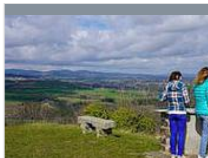
Table d'orientation de Montsupt

Situé dans les monts du Forez, sur les hauteurs de Chazelles-sur-Lavieu dans un bel environnement boisé donnant sur la plaine du Forez, le parc Acr'Oforez vous propose plusieurs attractions et activités que vous pouvez combiner avec Game'Oforez.